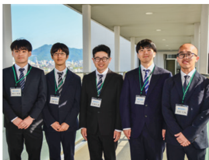
大阪教育大学教育学部教育協働学科4回生